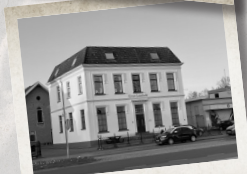
Huize Groot landzicht