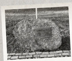
Oorlogsmonument vlakbij de Brandweerkazerne