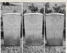
Graven van de omgekomen bemanningsleden